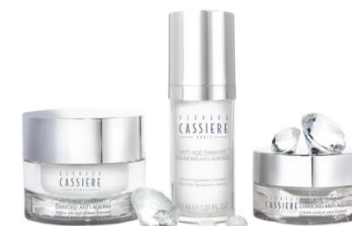
Diamond ダイヤモンド プレミアムエイジングケア※3

※1: 乾燥などの外的刺激から肌を保護する。 ※2: 潤いを与えキメを整えることによる ※3: 年齢を重ねた肌にうるおいを与えるケア。