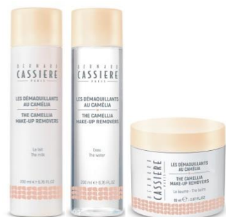
Cameraia カメリア クレンジング・ローション