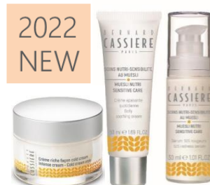
2022 NEW Muesli ミュズリー 敏感肌・乾燥肌