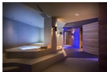
AMARIN Hotel (Croatia)