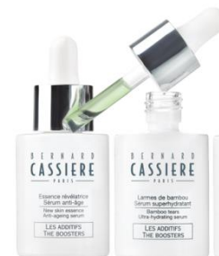
Booster ブースター 美容液