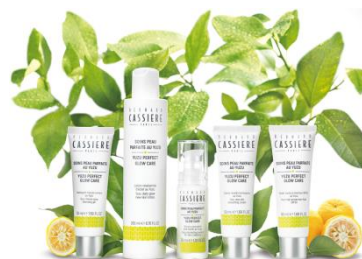
Yuzu ユズ 輝く肌へブライティング※2ケア