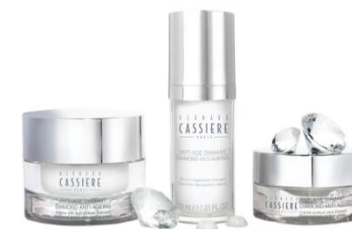
Diamond ダイヤモンド プレミアムエイジングケア※3

※1: 乾燥などの外的刺激から肌を保護する。 ※2: 潤いを与えキメを整えることによる ※3: 年齢を重ねた肌にうるおいを与えるケア。