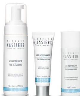
Cleansers クレンザー 洗顔料・ディープクレンジング