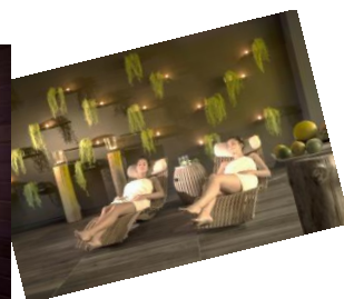
EXCELSIOR Lovran (Croatia)