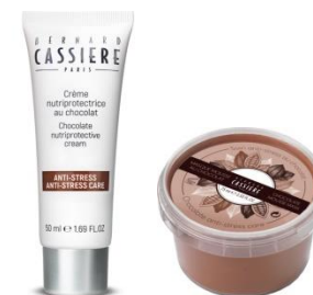
Chocolate ショコラ 外的ストレス※1の気になる肌