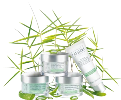
Bamboo aloe-vera バンブー・アロエベラ 水分不足肌