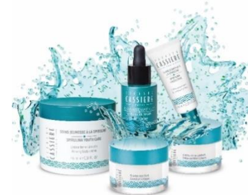
Spirulina スピルリナ エイジングケア※3